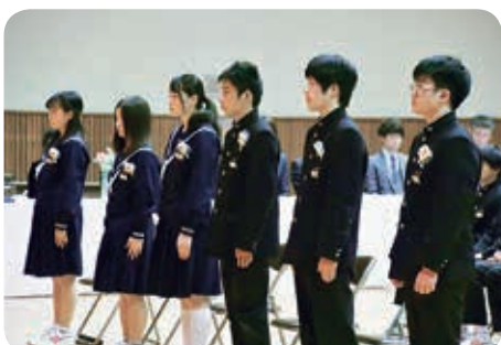
▲高野山中学校卒業式