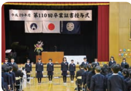
▲高野山小学校卒業式