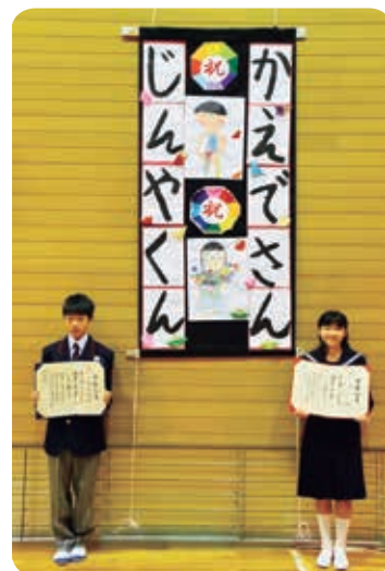
▲花坂小学校卒業式

卒業生は、先生方や在校生からの言葉をしっかり胸に受け止め、いつもより頼もしく見えました。