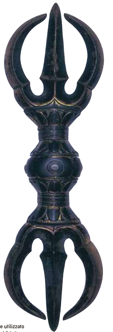
Sankosho Oggetto rituale utilizzato dai monaci buddhisti durante il culto.