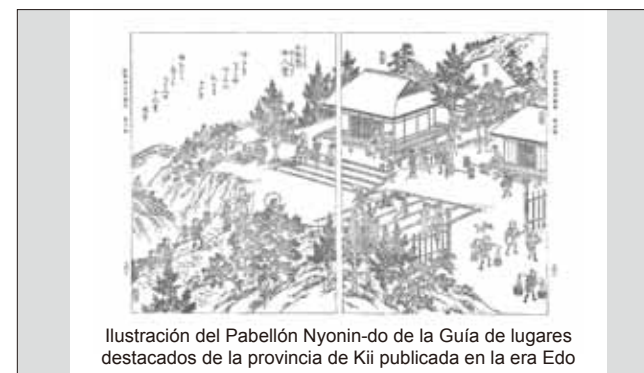
Ilustración del Pabellón Nyonin-do de la Guía de lugares destacados de la provincia de Kii publicada en la era Edo

El pabellón Nyonin-do, también conocido como pabellón de las mujeres, es el último de los siete pabellones que existieron en su día en los alrededores de Koyasan. Como Koyasan, era originalmente un lugar para que los monjes budistas pudieran formarse en paz, las mujeres tenían prohibido el acceso a los terrenos del templo. Por tanto, las mujeres tenían que andar por el sendero circundante a Koyasan hasta cada uno de estos pabellones para poder pedir por sus seres queridos, así como para promover su propia formación espiritual. Este sendero, conocido hoy día como Nyonin-michi o la ruta de peregrinación femenina, es popular entre los turistas como sendero con hermosas vistas sobre las montañas circundantes.