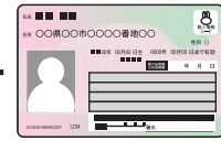
マイナンバーカード 等